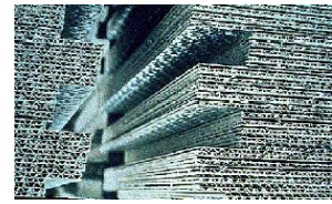
Plaques de faux-plafond