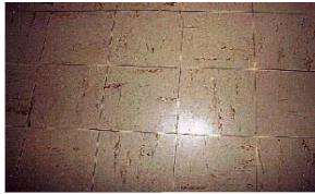
Dalles de sol