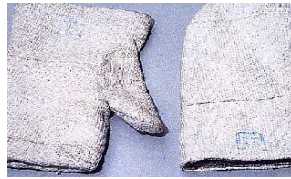
Gants de protection