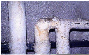
Calorifugeage de tuyaux