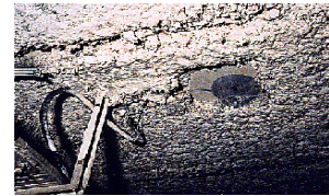
Flocage de plafond